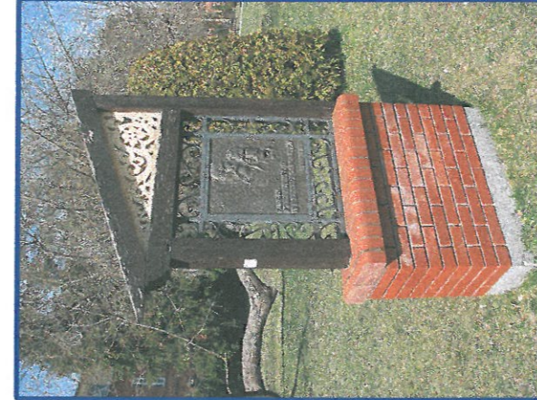
PRZESUNIĘCIE TABLICY W MIEJSCE PRZY WEJŚCIU DO ZABYTKOWEGO PARKU, WSKAZANE W PROJEKCJE