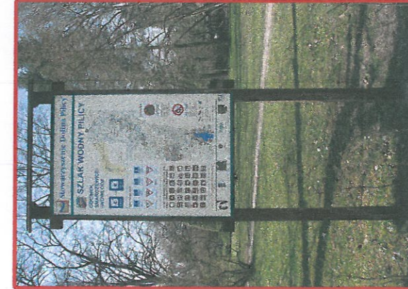
KONIECZNOŚĆ DOSTOSOWANIA TABLIC DO WZORCA MODELOWEGO