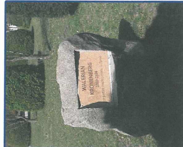
W FORMACH NATURALNYCH GLAZÓW ZALECA SIĘ NAPISY KUTE, A NIE MONTAŻ TABLIC