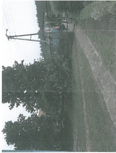
wejście od ul. Akacjiowej