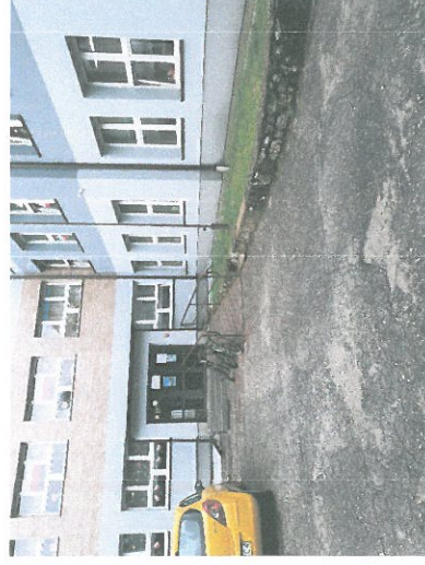
główne wejście do szkoły