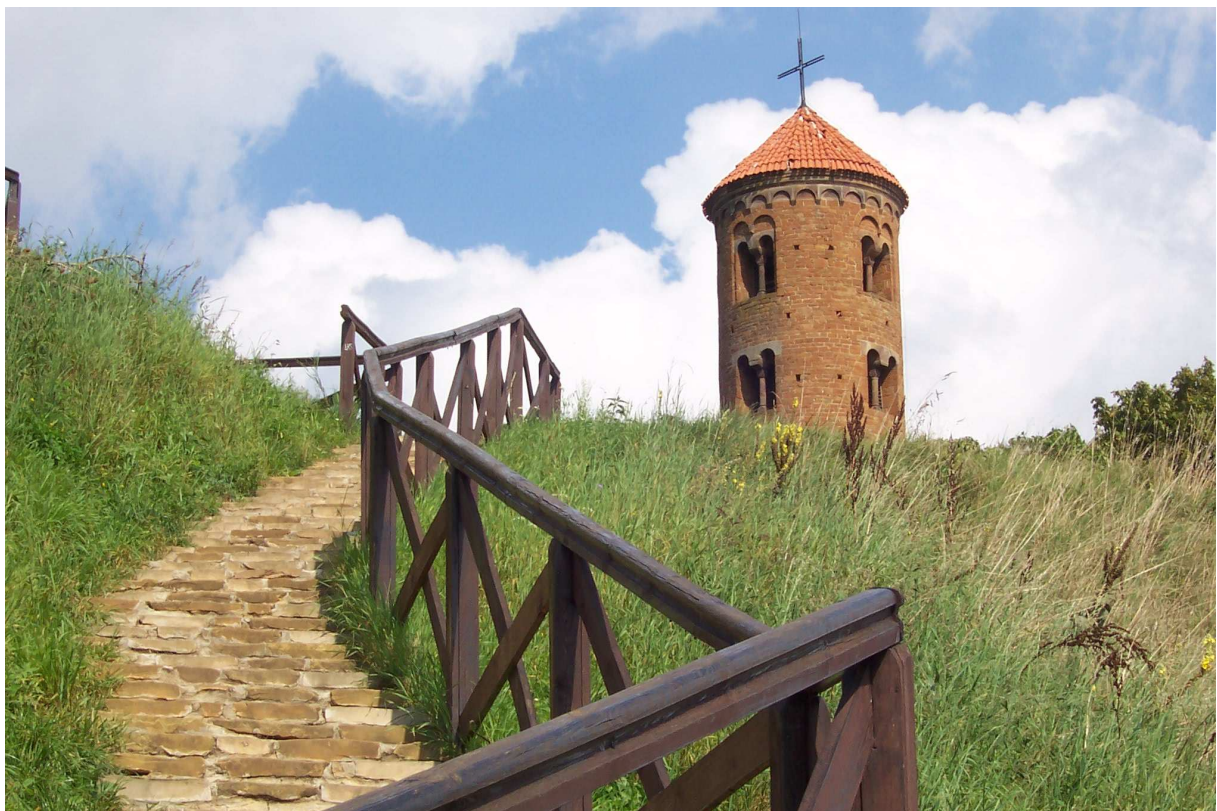
Kościół Św. Idziego